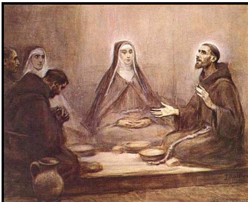
J. Benlliure: Comida de Santa Clara con San Francisco

Francisco, que había aprendido lecciones sublimes del soberano Maestro, no se avergonzaba, como verdadero menor, de consultar sobre cosas menudas a los más pequeños. En efecto, su mayor preocupación consistía en averiguar el camino y el modo de servir más perfectamente a Dios conforme a su beneplácito. Ésta fue su suprema filosofía, éste su más vivo deseo mientras vivió: preguntar a sabios y sencillos, a perfectos e imperfectos, a pequeños y grandes, cómo podría llegar más eficazmente a la cumbre de la perfección.